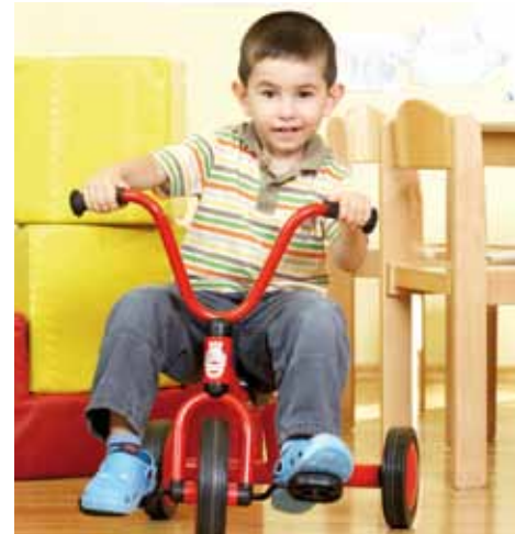
Durch Bewegung erforschen Kinder ihre Umwelt.

Bewegung ist eine fundamentale Handlungs- und Ausdrucksform von Kindern. Ihr kommt eine Schlüsselfunktion im Rahmen der Entwicklung kognitiver, emotionaler, sozialer und kommunikativer Fähigkeiten zu. Dem natürlichen Bewegungsdrang der